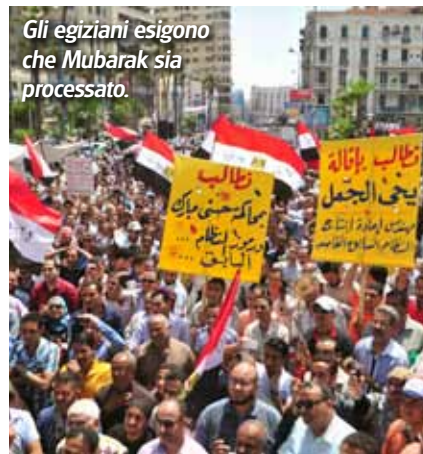
Gli egiziani esigono che Mubarak sia processato.

Da quando è cominciata l'ondata di proteste in Arabia lo scorso anno, la tensione tra musulmani e cristiani in Medio Oriente e Africa settentrionale si è notevolmente intensificata.