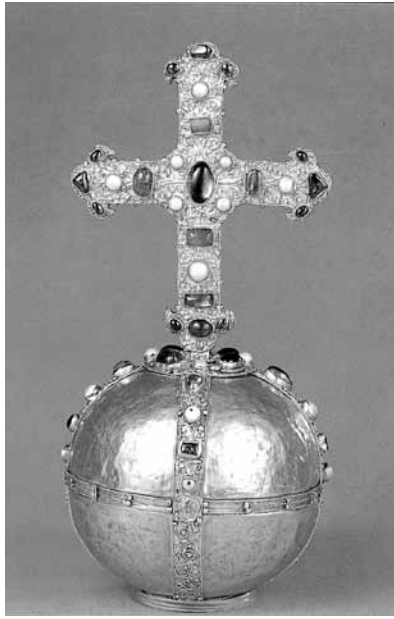
I gioielli della corona del Terzo Reich. Hitler rivendicava il possesso del Globo dell'Impero, della Corona e della Spada Imperiale.