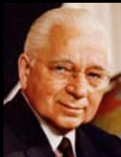
HERBERT W. ARMSTRONG

Voi siete un mistero. Il mondo intorno a voi è un mistero. Ma adesso potete finalmente comprendere!