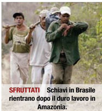
SFRUTTATI Schiavi in Brasile rientrano dopo il duro lavoro in Amazonia.

Viviamo negli ultimi giorni del lavoro forzato e dell'ingiustizia della schiavitù. Per comprendere di più il mondo che porrà fine a questi mali, e come avverrà, vi rimandiamo alla lettura de Il meraviglioso mondo di domani, ecco come sarà . ■