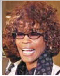
attrice/cantante Whitney Houston

1965- Famoso per l'uso di cocaina ed eroina