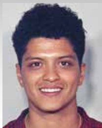
cantante Bruno Mars