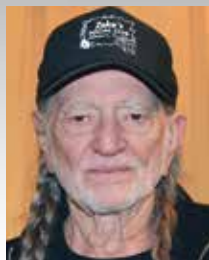
cantante/cantautore Willie Nelson