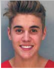
cantante Justin Bieber

1994- Famoso per usare marijuana e farmaci legali