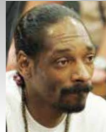
rapper/attore Snoop Dogg

1992- Famosa per l'uso di marijuana e di MDMA