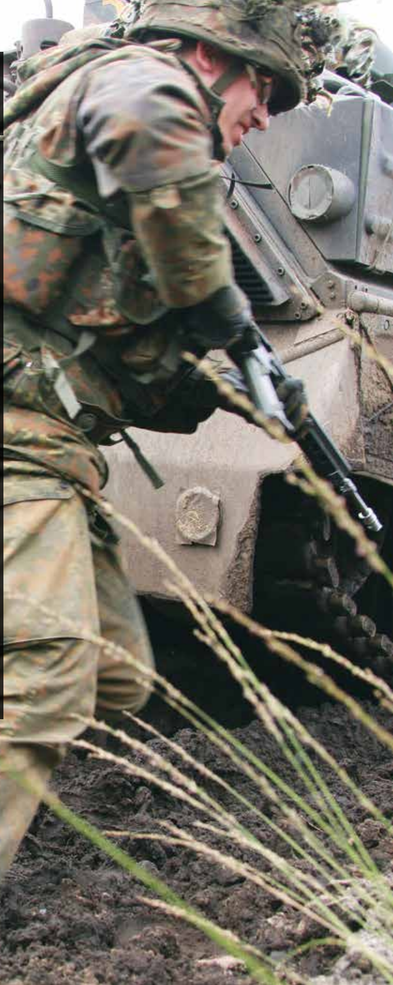
Illustrazione di copertina: Gary Dorning/Trumpet

Foto: Soldati tedeschi del 92° Battaglione di Fanteria corazzata impegnati in esercizi di allenamento.