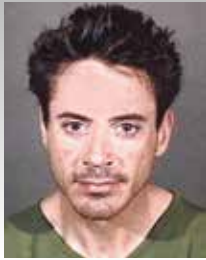
attore Robert Downey Jr.

1965- Famoso per l'uso di cocaina ed eroina