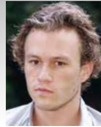
attore Heath Ledger

1963-2012 Morì a causa di una dose eccessiva di cocaina e farmaci legali