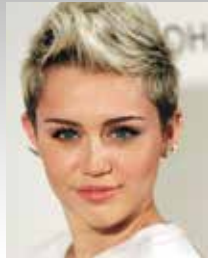
cantante/attrice Miley Cyrus

1994- Famoso per usare marijuana e farmaci legali