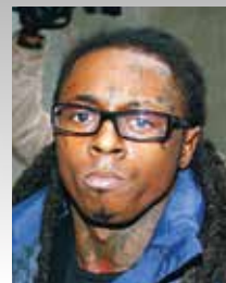
rapper Lil Wayne

1982- Famoso per l'uso di marijuana, di crack, farmaci legali, e arresti multipli