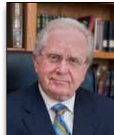
GERALD FLURRY EDITORE

"La Germania è anche in posizione geografica e commerciale per dominare qualsiasi cosa emerga dalle macerie di questa re-