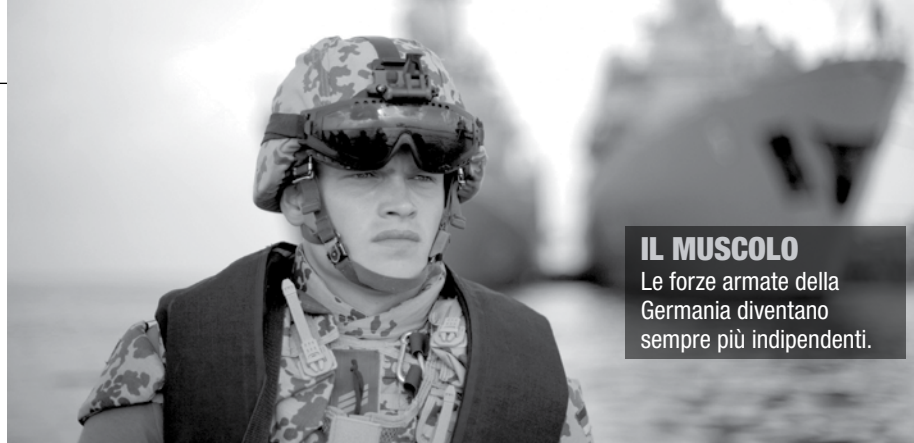
IL MUSCOLO Le forze armate della Germania diventano sempre più indipendenti.