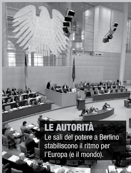
LE AUTORITÀ Le sale del potere a Berlino stabiliscono il ritmo per l'Europa (e il mondo).

È tutto troppo vicino al vecchio sogno nazista per essere una coincidenza.