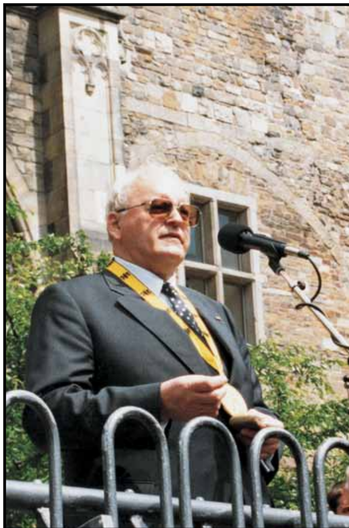
Erede di un legato Roman Herzog ha ricevuto nel 1997 il Premio Internazionale Carlomagno

Dieci anni dopo, egli fu incoronato imperatore a Roma dal Papa, e il legame tra Chiesa e Stato fu rianimato una volta di più. Benché Carlo avesse giurato di difendere la Chiesa Cattolica, egli fece qualche vano tentativo per riparare la breccia nel mondo religioso, formatasi dalla ribellione di Lutero nel 1517. Nondimeno, la sua persecuzione contro gli Arabi e i Giudei è