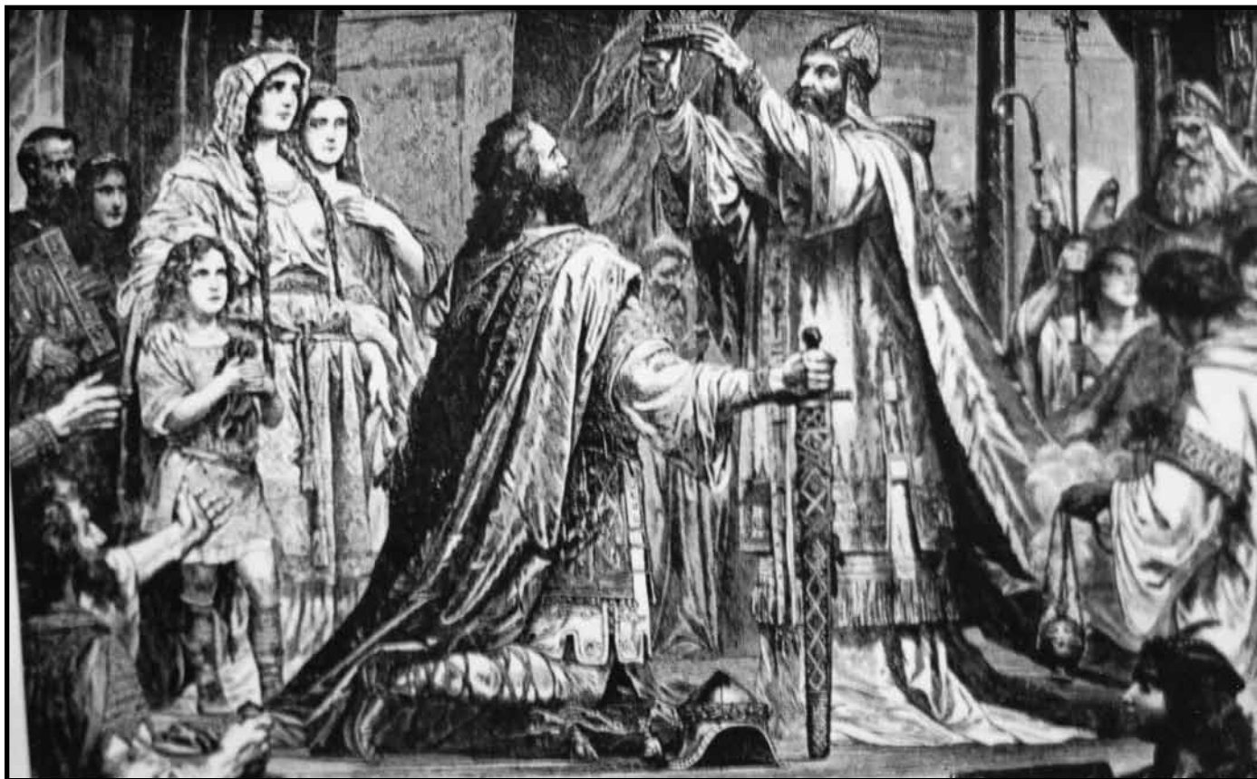
Il Sacro Imperatore Romano Il Papa incorona Carlomagno nella cattedrale di San Pietro

Come molti che seguirono le sue tracce, Ottone era un guerriero spietato che si servì della spada per diffondere il “Cristianesimo”. L'Encyclopedia Britannica dice che era “soggetto a violenti eccessi d’ira” e che “la sua politica era quella di schiacciare ogni tendenza all’indipendenza” (11ª edizione, vol. 20, articolo “Otto I”).