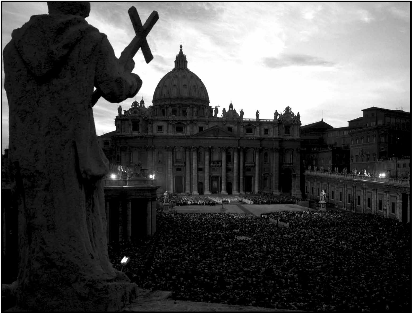
Piazza San Pietro, il cuore della Città del Vaticano

ciascuna è stata fortemente influenzata, e in certi casi dominata, dal Vaticano.