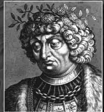
Otto il Grande