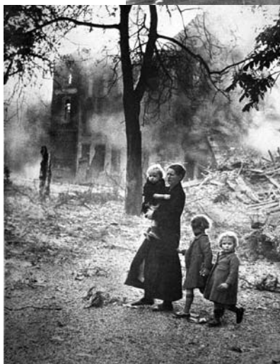
Prima e dopo Dopo aver ricevuto una delle peggiori legnate, la Germania è ritornata quasi immediatamente. A destra: Berlino

Più tardi, prendendo come esempio la Baviera, Connell definì una farsa lo sforzo della denazificazione tedesca, dicendo che “l’amministrazione bavarese è principalmente nelle mani di coloro che la controllavano sotto Hitler”. Le ricerche di Connell verificavano una dichiarazione: “Le statistiche mostrano che 20.682 dei 49.445 funzionari civili appartenevano al partito nazista o ai suoi affiliati. Esattamente 14.443 persone erano state licenziate e più tardi reintegrate nelle loro funzioni. Quasi la totalità degli 11.000 insegnanti, che erano stati rimossi per ragioni politiche, sono stati riammessi, rappresentando circa il 60 per cento del corpo docente impiegato dal Ministero dell’Educazione; il 60 per cento dei 15.000 impiegati nel Ministero delle Finanze sono degli ex nazisti, come anche l’81 per cento dei 924 giudici, magistrati e procuratori del Ministero della Giustizia” (pag. 107).