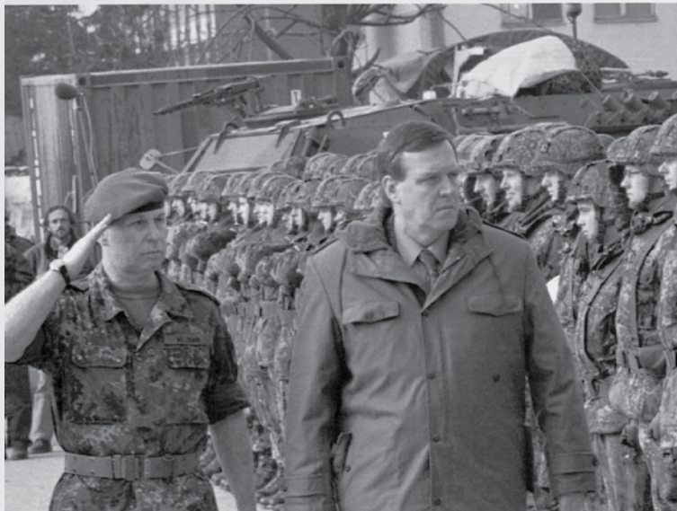
Ritorno all'iniziativa Volker Rùhe ispeziona le truppe tedesche di stanza a Sarajevo.

Il tempo dirà se, nella Bundeswehr, ci siano altre migliaia che hanno simpatie di estrema destra, e che abbiano, fino ad ora, mantenuto discrezione. Intanto, il numero degli incidenti violenti nella Bundeswehr continua ad intensificarsi. Fin tanto e a misura che questo numero aumenta e che la gente si abitua, gli articoli sui nazisti che s'infiltrano nell'esercito tedesco saranno ben presto relegati nell'ultima pagina dei numerosi giornali, prima di sparire. Gli articoli potranno sparire, ma non i nazisti. ■