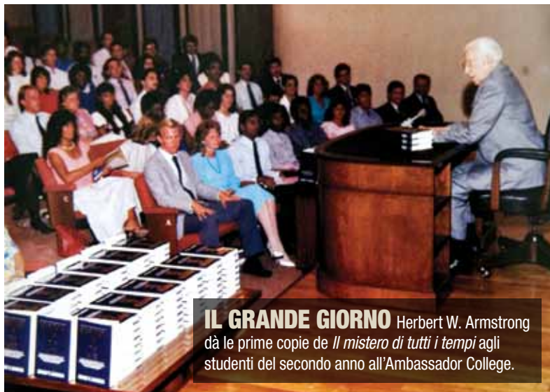
IL GRANDE GIORNO Herbert W. Armstrong dà le prime copie de Il mistero di tutti i tempi agli studenti del secondo anno all'Ambassador College.

Il signor Tkach ha riconosciuto che il signor Armstrong volle oltrepassare assai i confini della Chiesa con la distribuzione del libro, che lo vedeva come un regalo di allontanamento dai “milioni.” Dunque il signor Armstrong aveva approvato il progetto di serializzazione ed anche la distribuzione nelle librerie, la campagna pubblicitaria, il comunicato stampa e la posta diretta e la offerta per mezzo de “Il mondo di domani.” “Poco prima di morire”