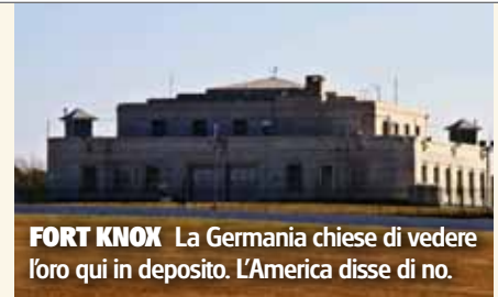
FORT KNOX La Germania chiese di vedere l'oro qui in deposito. L'America disse di no.

Questo è ciò che il direttore della Tromba Gerald Flurry scrisse dopo che la Russia invase la Georgia nel 2008: «Io credo che sia molto probabile che la Germania e la Russia abbiano già stipulato un accordo. ... La presenza di un patto fra queste due nazioni non è un segno di pace. Come il patto di Molotov-Ribbentrop, e così tanti altri prima di quello, è un segnale di esattamente l'opposto. Entrambe queste nazioni sono in cerca di assicurarsi i loro confini—così che possono perseguire i loro scopi imperialistici altrove! È un precursore di guerra! Questo è il loro modo di operare! E gli USA non ne hanno la minima idea.»