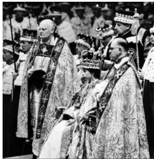
IL TRONO La regina Elisabetta II è stata incoronata sopra una pietra speciale su cui poggia un antico trono con una storia incredibile.

“È una strana coincidenza - o è soltanto una coincidenza? - che molti re nella sto-