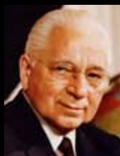
HERBERT W. ARMSTRONG

Voi siete un mistero. Il mondo intorno a voi è un mistero. Ma adesso potete finalmente comprendere!